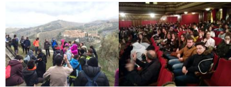
Ruta del agua